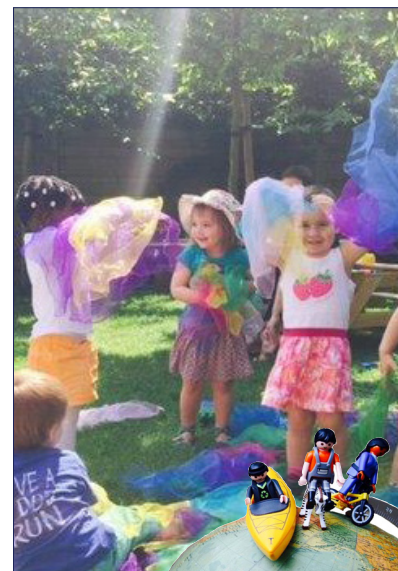
E L F E N B A N K J E