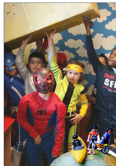
K L E U T E R S C H O O L