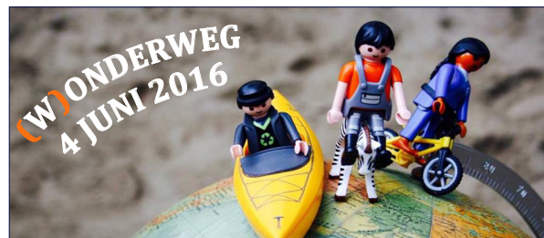
L A G E R E S C H O O L

LINKERVLEUGEL EN KLIMHOEK VAN 14.30 TOT 16 UUR.